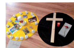
Allerheiligen / Allerseelen am 27. Oktober 2018