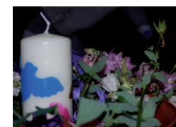
Pfingsten am 8. Juni 2019