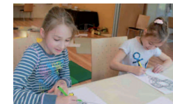
Fastenzeit / Leben Jesu am 23. März 2019